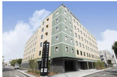
北棟、南棟からなる総客室200室。変なホテル客室最大を誇ります。(外観イメージ)