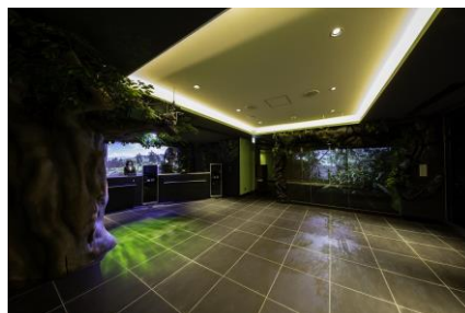
フロントにはロボットと3D映像がお出迎え

シアターツイン extra ルーム(21.62~24.18㎡) 宿泊料金1室/22,000円~:5室 (ユニバーサルルーム1室含む)