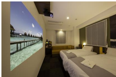
変なホテル初の「シアタールーム」が誕生 (シアタールームは70室完備)