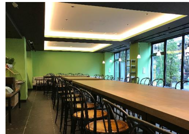
ホテル併設レストラン「アーリーバードダイニング」にて早朝5:30から営業。朝食は種類豊富なインターコンチネンタル&和食ブッフェをご用意