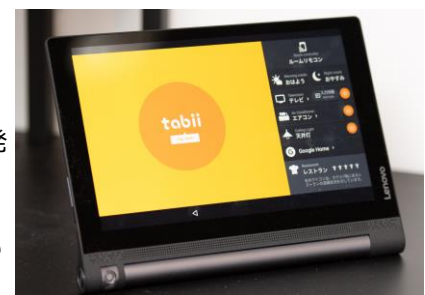
Tabii:館内外の情報収集と照明、空調、TV等のあらゆる客室機器との連動をすることができます。