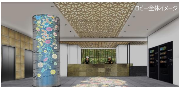
ロビー全体イメージ