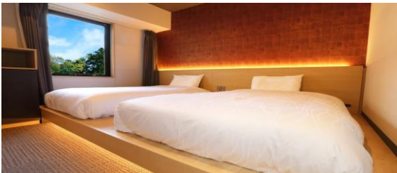
ジャパネスクルーム一例

床を一段高とした小上がりの上にベッドを配した和を感じさせる客室で、ツイン・トリプルの 2 タイプをご用意。女子旅や訪日外国人のお客様にもおすすめです。