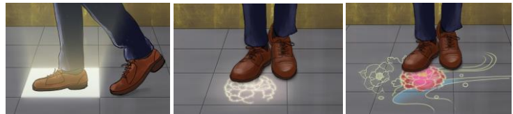
変化するプロジェクションマッピングイメージ

ロビーの床、光る石を踏むと、柱と床面などロビー全体に加賀友禅を模したプロジェクションマッピングが展開されます。フロントでは恐竜ロボットがお出迎え。チェックインからワクワクと感動をご提供いたします。